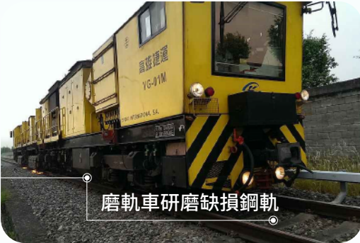
磨軌車研磨缺損鋼軌