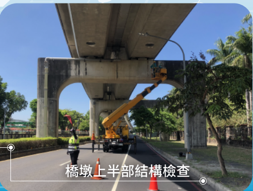
橋墩上半部結構檢查