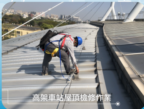
高架車站屋頂檢修作業