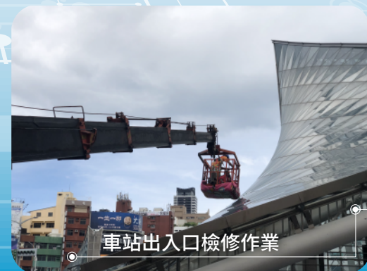
車站出入口檢修作業