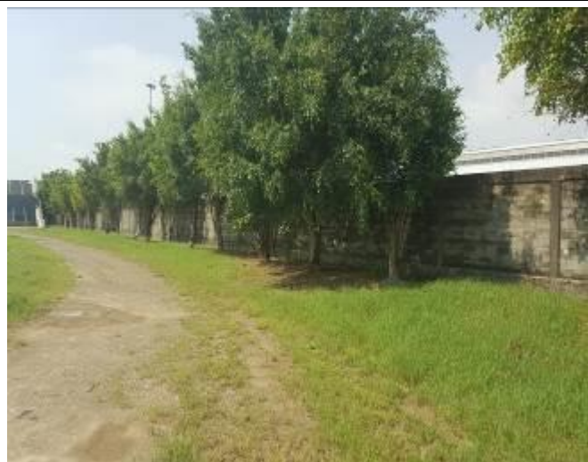
D-1 區綠地雜草修剪及環境整理