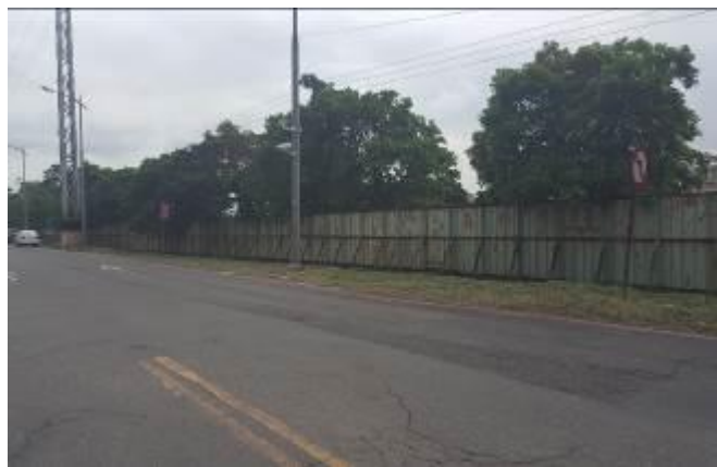
A區道路兩旁除草完成