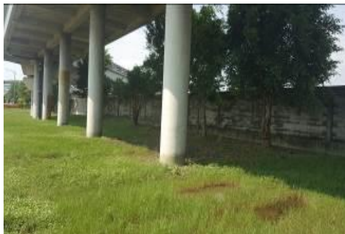
D-1 區綠地雜草修剪及環境整理