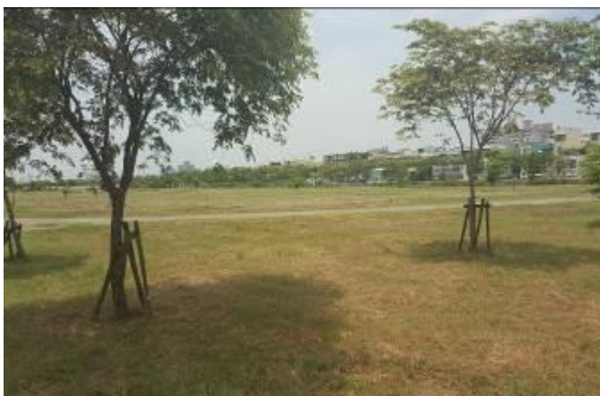
D-1 區綠地除草、樹枝修剪及環境整理