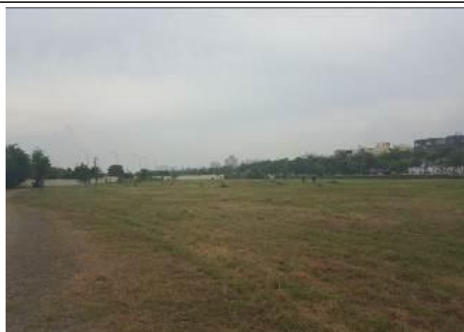
D-1 區綠地除草及環境整理