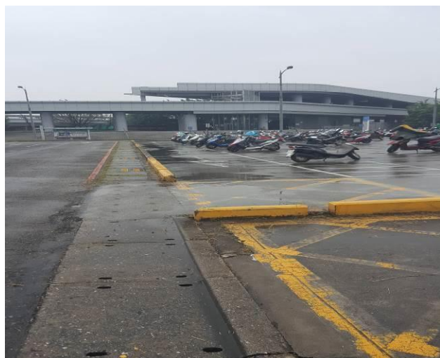
A區停車場綠地修剪、除草及環境整理