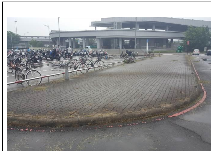
A區停車場綠地修剪、除草及環境整理