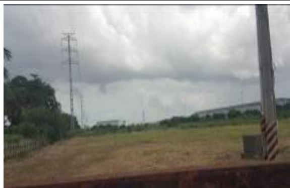
B區範圍綠地除草整理