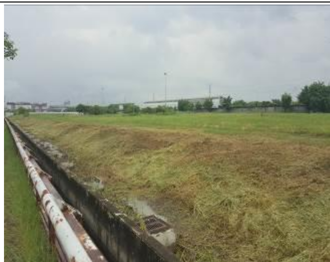
D-2 區綠地除草及環境整理