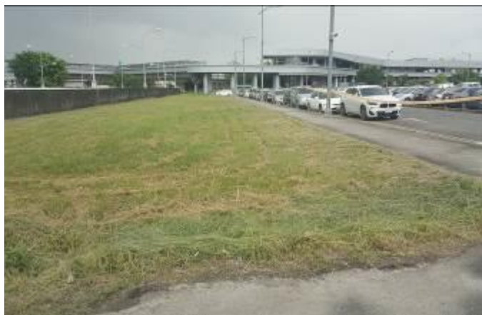
A區綠帶修剪、除草及環境整理