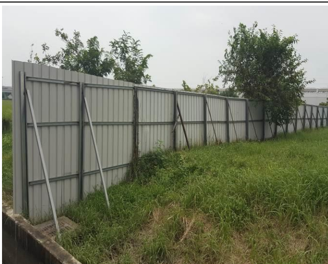
D-2 區綠地除草及環境整理