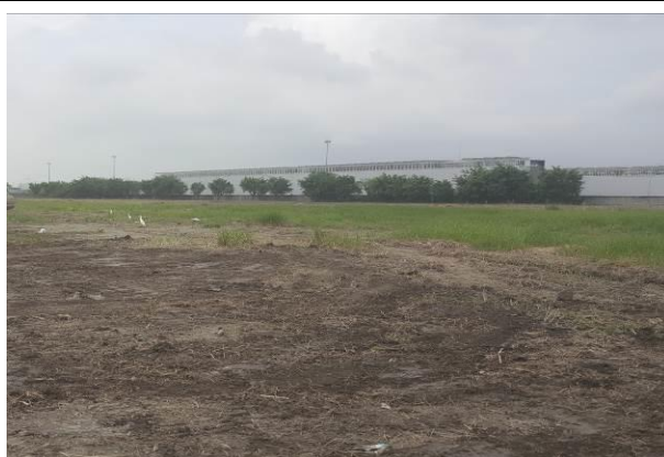
B區範圍綠地除草整理