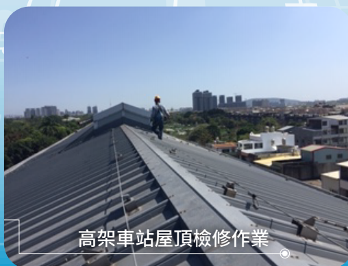
高架車站屋頂檢修作業