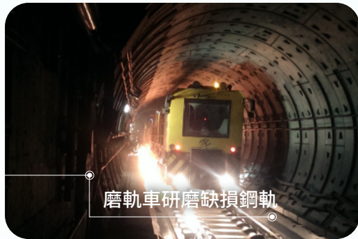
磨軌車研磨缺損鋼軌