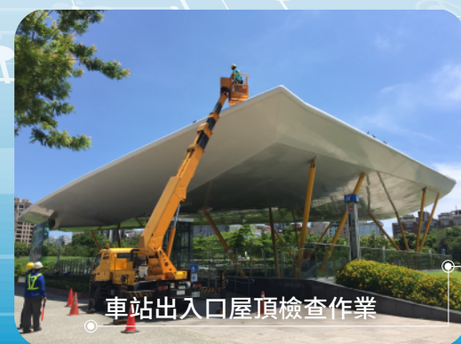
車站出入口屋頂檢查作業