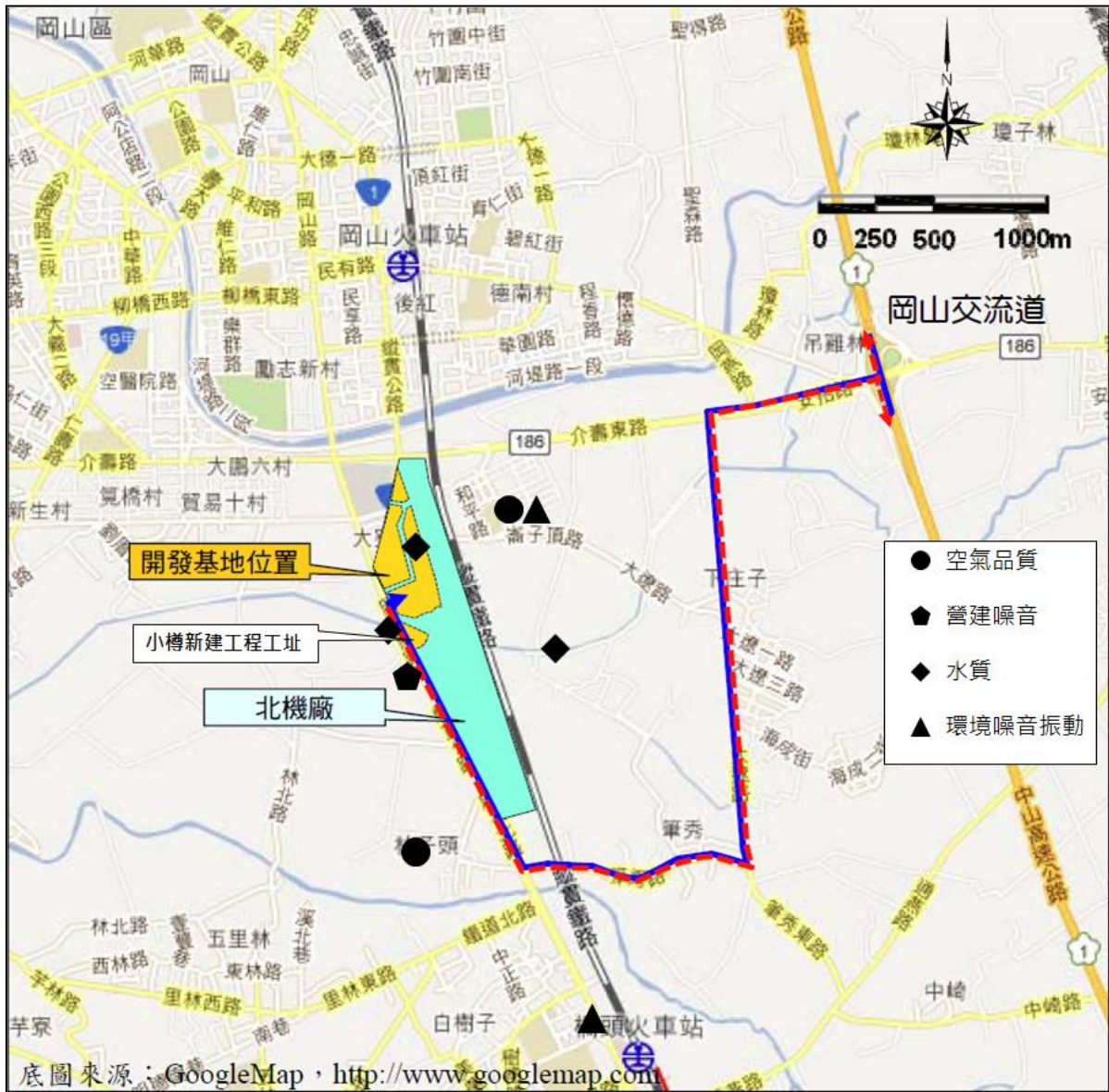
圖 1.4-1 環境監測位置示意圖

有關本計畫施工期間空氣品質、營建噪音、環境噪音振動、放流水水質、地面水質及地下水水質之監測位址如圖 1.4-1 所示。